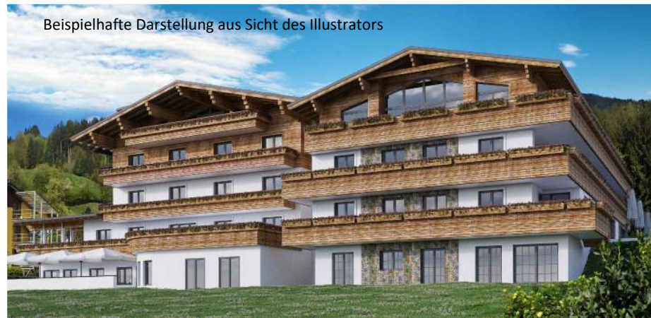
Beispielhafte Darstellung aus Sicht des Illustrators